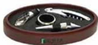
Set de Vinos

Entrega sujeta a disponibilidad y/o stock.