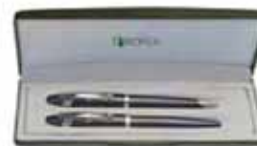
Set de Roller y Bolígrafo de metal

Entrega sujeta a disponibilidad y/o stock.