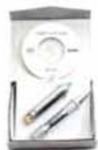
Pen drive-Bolígrafo 512 MB