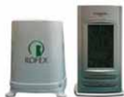
Estación Digital con Pluviómetro

Entrega Sujeta a disponibilidad y/o stock.