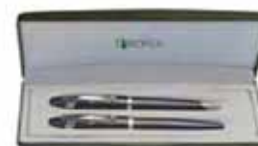
Set de Roller y Bolígrafo de metal

Entrega sujeta a disponibilidad y/o stock.