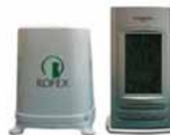
Estación Digital con Pluviómetro

Entrega sujeta a disponibilidad y/o stock.